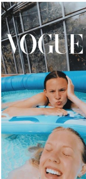
Kusjes van jullie twee modellen XX

Meer exacte info over het feest volgt nog. Wat we wel al kunnen meegeven is dat er zaterdag 3 mei vanaf 13u kindersanimatie zal zijn! En iedereen is daar welkom, al je vrienden, zelfs die van de Chiro zijn welkom! Wat er voor de rest van het weekend gebeurt zullen we nog medelen in een uitnodiging voor jullie allen! Zet het alvast in de agenda tot dan!!!