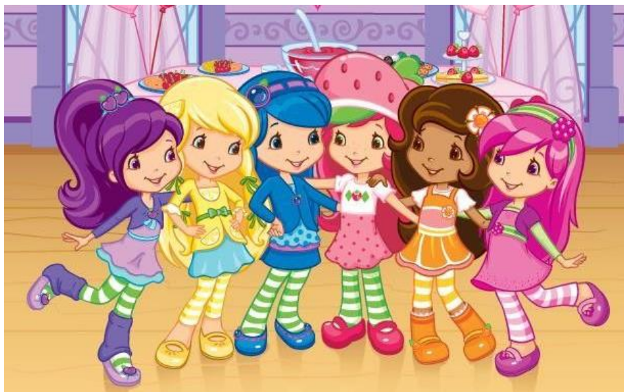
Narwal, Serval, Leeuwaapje, Vermakelijke Agame, Nijlpaard & Otter

xxx Scoutieve groetjes en alvast een fijn Pasen xxx