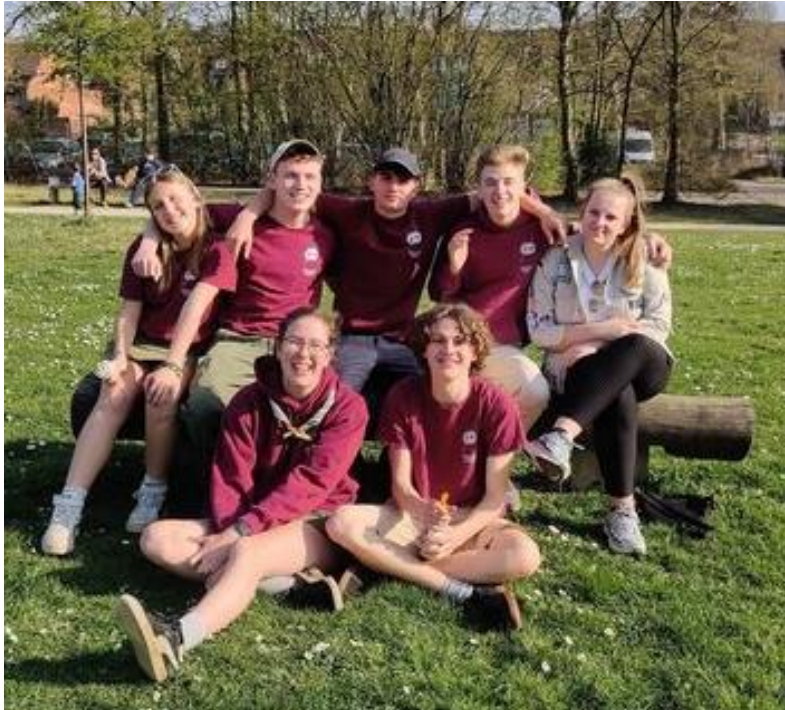
Gnoe - Kwikstaart - Zeepaardje - Frivole Streepmuis - Pittige Sneeuwhoen Sofie - Agame