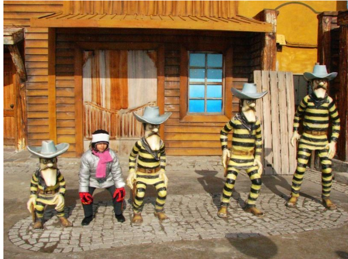
GROETJES VAN JULLIE NIEUWE FAVO LEIDING xxxx

Yow besties vandaag wordt de tofste dag van jullie leven 😄! Hiervoor worden jullie om 13u45 aan de Joengele. Droom al maar van een originele kreet want voor je het weet laat coscoroba een spetterende scheet. We vliegen erin met een grote verrassing en jammer genoeg is de pret niet van lange duur want om 17u draaien we het stuur en keren we weer naar huis 😞.